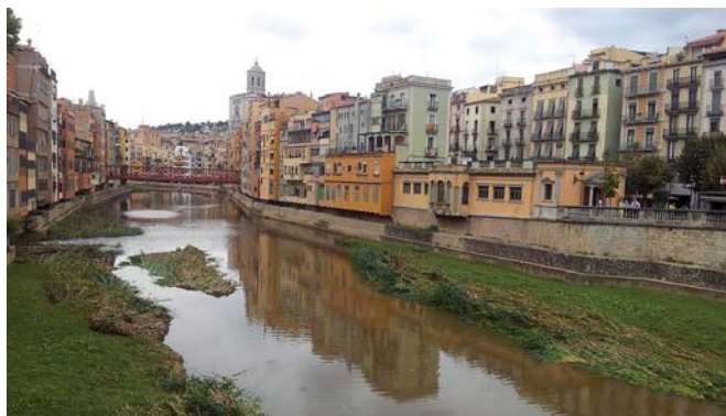
Vista de la ciudad de Girona