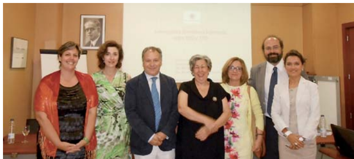
La doctoranda con los miembros del tribunal