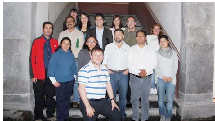
Alumnos del Curso de Experto en Agroalimentación. BUAP, México

En el marco de este Curso, se celebró, en la Universidad Simón Bolívar en Barranquilla, Colombia, un ciclo de conferencias con el título genérico de Lecciones de Urbanismo, Arte y Arquitectura. El mencionado ciclo se llevó a cabo en el Teatro José Consuegra Higgins al que durante los dos días de duración, 15 y 16 de marzo, asistieron cerca de 500 personas, siendo el número de matriculados superior a 400 alumnos. En la inauguración del curso estuvieron presentes los dirigentes universitarios así como altas personalidades de la cultura y las artes.