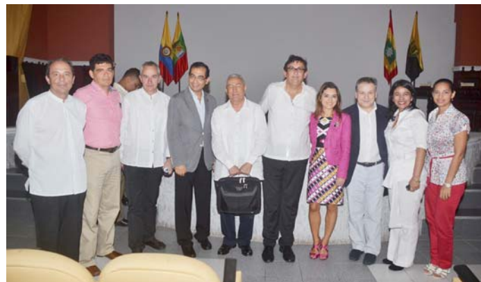
Directivos y profesores en la inauguración del Curso de Experto en Gestión del Patrimonio en la Universidad de Cartagena, Colombia

alumnos, de los cuales 15 (cuatro de ellos provenientes de Bolivia y Guatemala) han sido becados para realizar la posterior fase de investigación y de realización de la tesis doctoral en la Universidad de Granada.