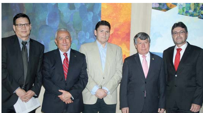
Acto de inauguración del Curso de Experto en Gestión de la Paz y los Conflictos en la Universidad del Valle, Colombia

Así mismo, una nueva edición de este Curso de Experto en Gestión de la Paz y los Conflictos, esta vez en colaboración con la Universidad del Valle, Colombia, se inauguró el día 1 de abril en la ciudad de Cali. La presentación pública del programa de Doctorado contó con la presencia del Rector de la Universidad del Valle y de los directores académicos del programa. La finalización de este curso presencial está prevista para el 17 de mayo. Igualmente, 15 alumnos que superen este curso serán becados para continuar con la fase de investigación que les llevará a la obtención del título de Doctor por la Universidad de Granada. Noticia ampliada e imágenes de la inauguración pueden verse en www.aui.org