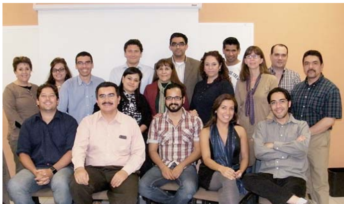
Participantes en el Curso de Experto en Gestión de la Paz y los Conflictos en la UAS, México

Entre el 26 de enero y el 17 de marzo se celebró, en dependencias de la Universidad Autónoma de Sinaloa (México), el Curso de Experto en Gestión de la Paz y los Conflictos correspondiente a la primera fase de complementos formativos del Programa de Formación de Doctores en Gestión de la Paz y los Conflictos, coordinado por la Universidad de Granada, España. Quince alumnos, cuatro de ellos provenientes de Argentina, Venezuela y Cuba, han sido becados para realizar la posterior fase de investigación y de realización de la tesis doctoral en la Universidad de Granada.