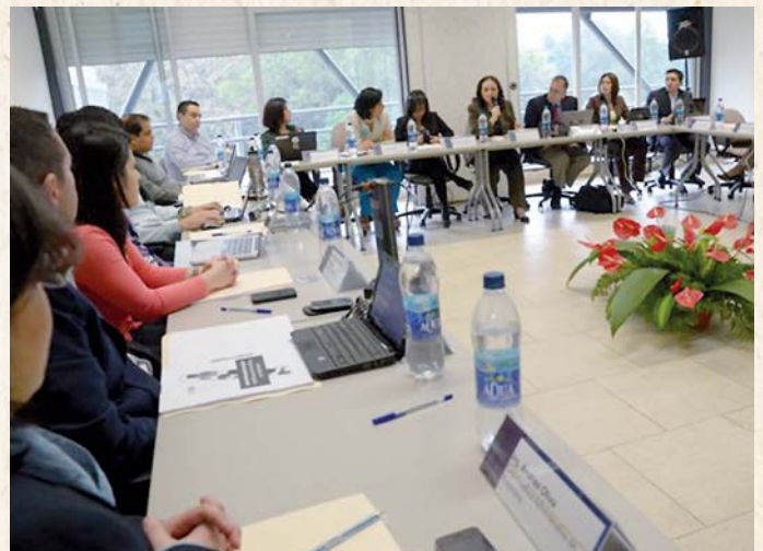
Misión técnica en la Universidad Rafael Landívar de Guatemala