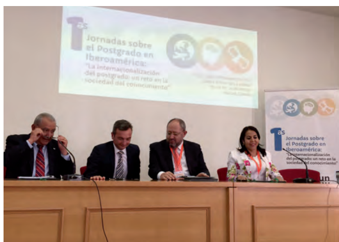
Assinatura dos Convênios de Colaboração para a realização de dois Programas Ibero-americanos de Formação Doutoral, um na área de Ciências do Mar e o outro nas disciplinas relacionadas com as Artes, no marco das 1as. Jornadas Internacionais sobre a Pós-graduação em Ibero-América (La Rábida, Huelva, 23 de setembro de 2016)