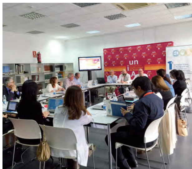
Reunião de Diretores Regionais (La Rábida, 19 setembro 2016)