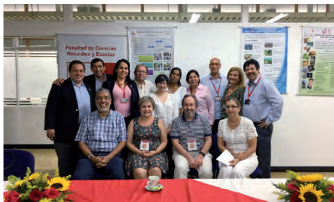
Fotos da visita dos pares acadêmicos aos programas de doutorado e mestrado em Ciências-Biologia da Universidade del Valle, Colômbia