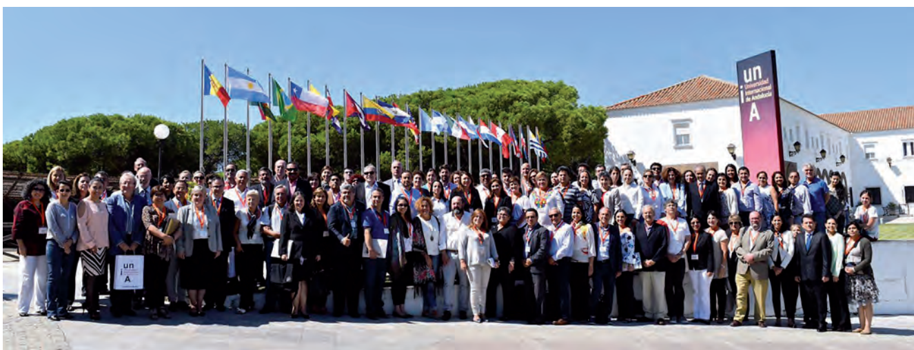
Foto de grupo dos assistentes às Primeiras Jornadas Internacionais sobre a Pós-graduação em Ibero-América, La Rábida, Huelva, 19 a 23 de setembro de 2016