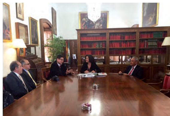
Reunião da diretoria da AUIP com a Reitora da UGR e o Reitor da Universidade del Valle para colocar em andamento uma nova edição do Programa de Formação Doutoral em Gestão da Paz e dos Conflitos (Granada, 12 de maio de 2016)