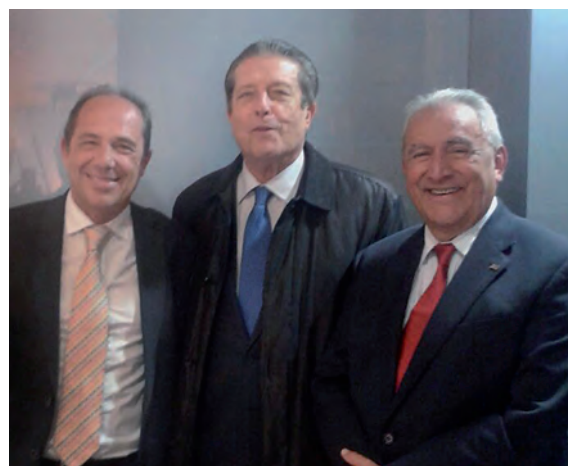
Encontro do Diretor-Geral e do Diretor-Adjunto da AUIP com o Sr. Federico Mayor Zaragoza no dia 13 de maio de 2016 em Granada