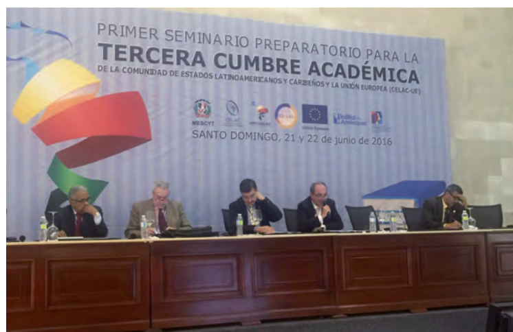
Mesa inaugural do Primeiro Seminário Preparatório para a Terceira Cúpula Académica da Comunidade dos Estados Latino-americanos e Caribenhos e a União Europeia (CELAC-UE)