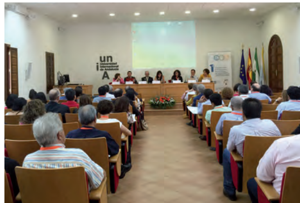
Inauguração das Jornadas realizadas em La Rábida de 19 a 23 de setembro de 2016