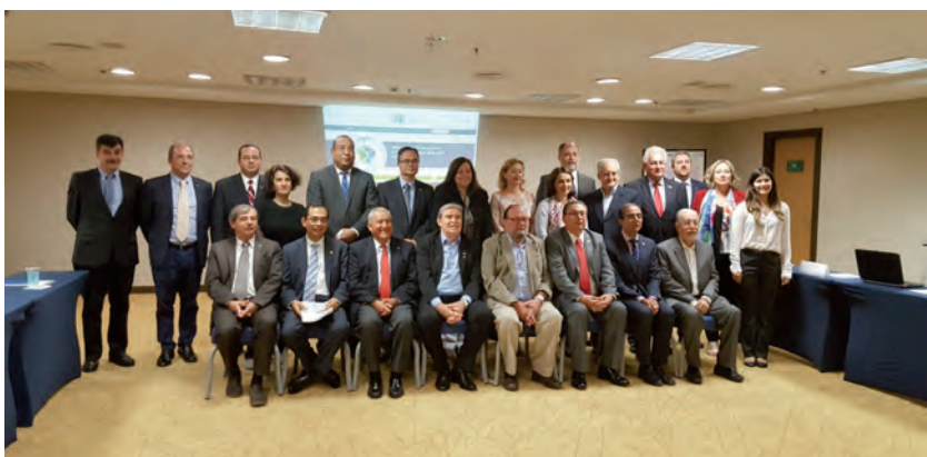
Acima: Assembleia Geral realizada em Sevilha (7 e 8 de março de 2016) Abaixo: Reunião da Comissão Executiva São Paulo (10 e 11 de outubro de 2016)