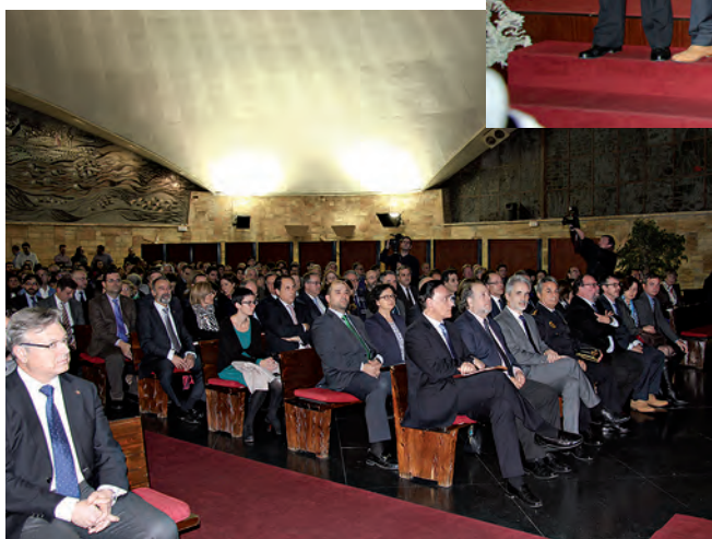
Visão geral do auditório